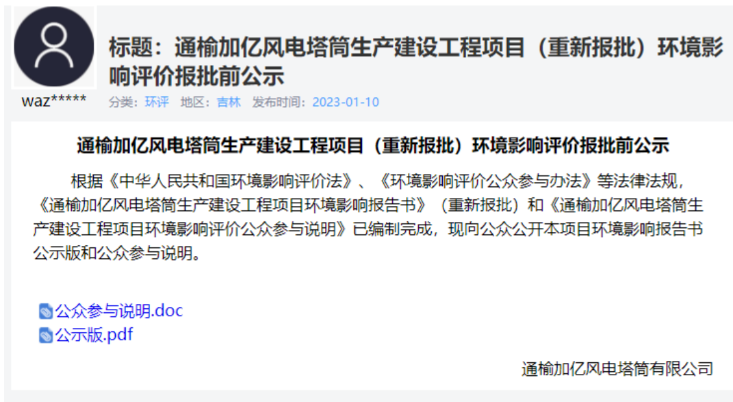
图 5 报批前网络公示截图