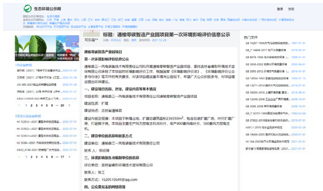
图 1 第一次网络公示截图