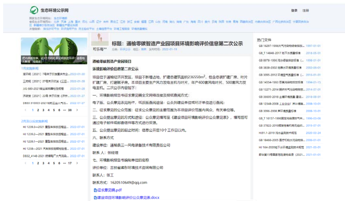
图 2 网站征求意见稿公示截图