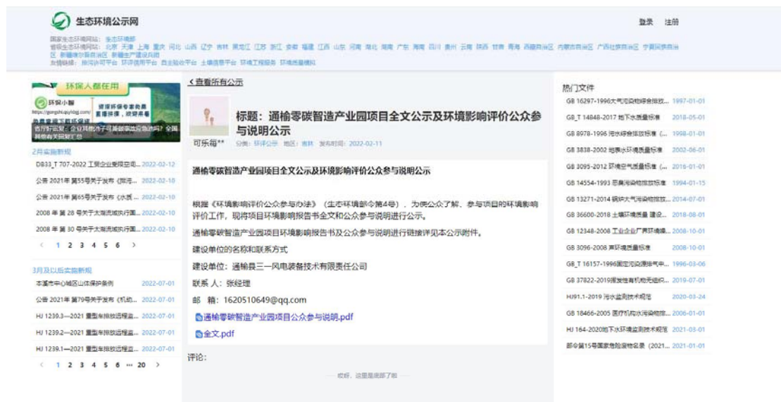
图 6-1 报告书全文和公众参与说明公开页面截图