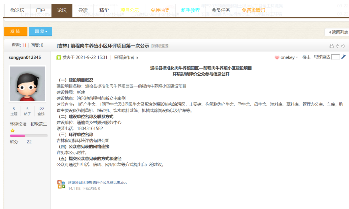
图 2-1 网页截图