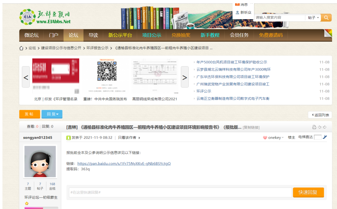
图 6.2-1 报批前公示