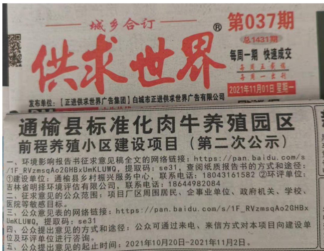
图 3.2-3 报纸公示