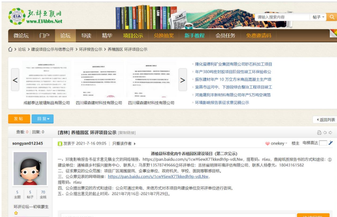
图 3.2-1 网页截图